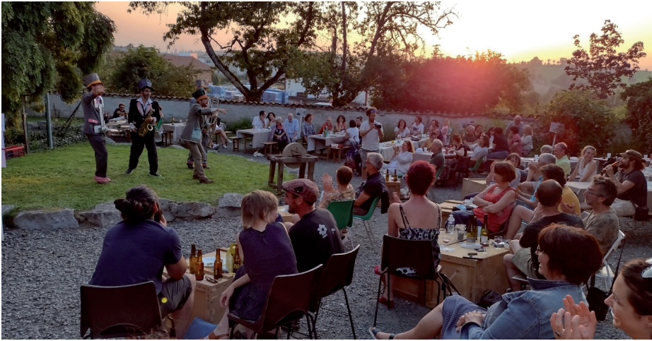
Apér'o Musée dans le jardin de la manufacture