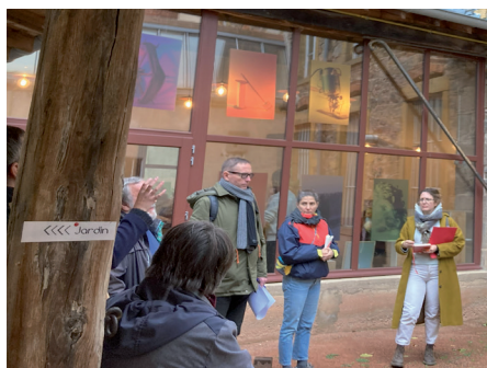
Visite du site par l'équipe de maîtrise d'oeuvre