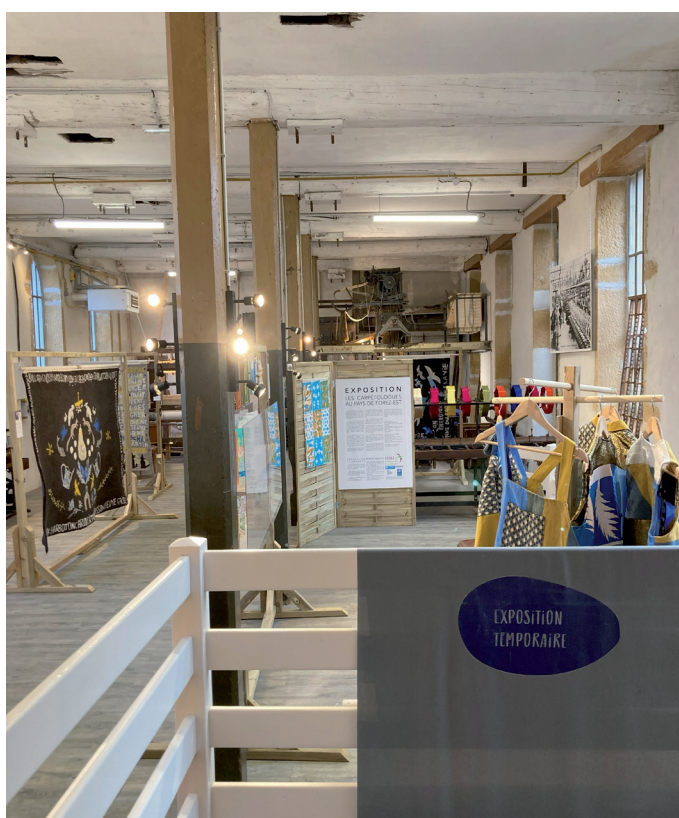
Exposition Les Carpétologues au Pays de Forez-Est

En phase d'avant-projet, les premières projections et plans de l'étude de maîtrise d'oeuvre ont été projetés afin de visualiser les nouveaux espaces et aménagements proposés.