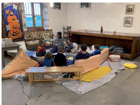
Heure du conte à la manufacture - 25/10