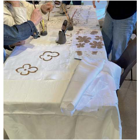
Atelier teinture avec du brou de noix par le Club de SPORES