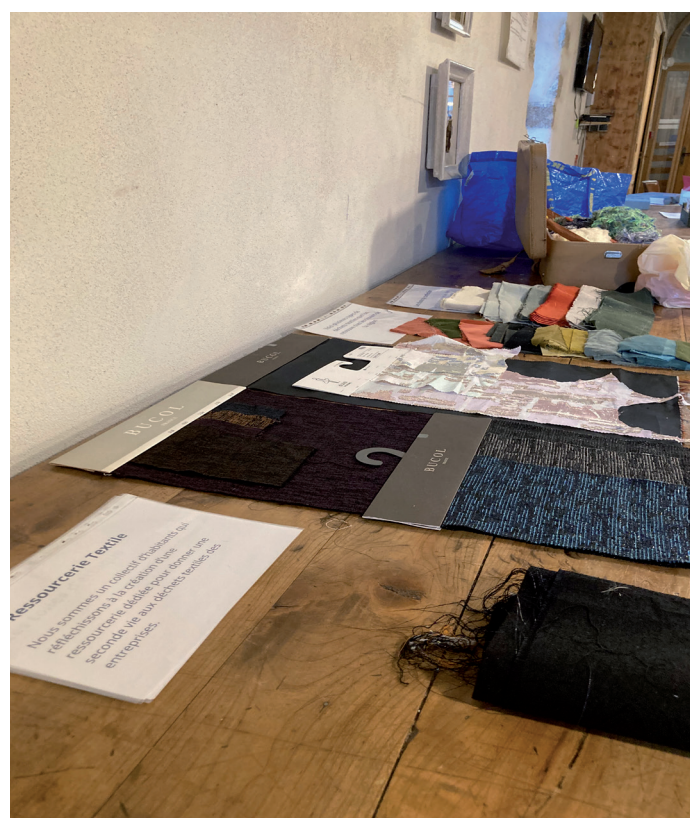
Exposition des chutes de tissus - Collectif textile des Montagnes du Matin