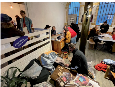
Journée de préfiguration du 19/11