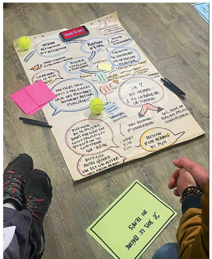
Réculte du dialogue entre acteurs - temps fédérateur du 16/12