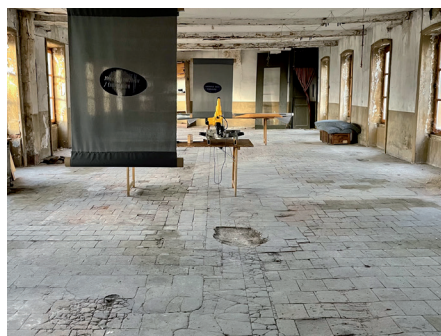
Journée de préfiguration du 19/11