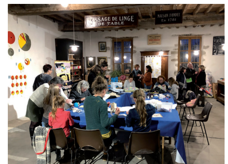
Journée de préfiguration du 19/11