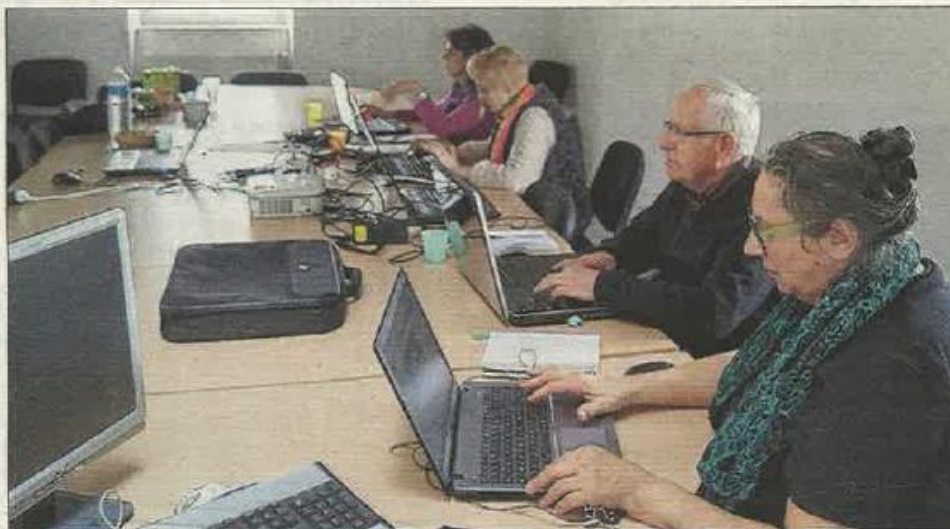
■ L'atelier d'accompagnement au numérique.

100 Le nombre de participants aux ateliers numériques, passés à l'office de tourisme.