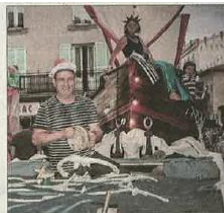
■ Le char de l'école privée Jeanne-d'Arc.