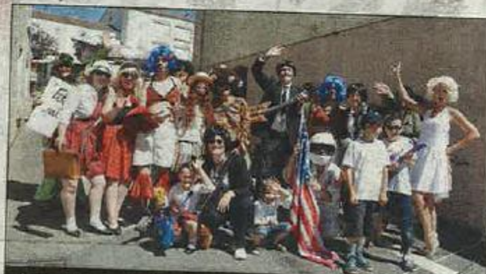
JOIE. Les Grands champs au son de la musique.