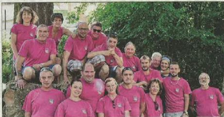
■ La belle équipe du comité des fêtes.

Sous un soleil caniculaire, la fête de la Saint-Jean s'est remarquablement bien passée de vendredi à lundi. De nombreuses animations ont été préparées par les bénévoles et l'aide de certaines associations du village.