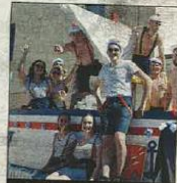
DÉFILÉ. Le char des classes en 7.