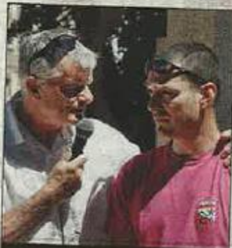
SAINT-JEAN. Le maire et le co-président du comité.

À la salle d'animation, le lundi, une paëlla était servie par l'U.C.A.P. suivie de réboire et karaoké. Tout au long des 4 jours de fêtes, il y a eu les attractions foraines. ■