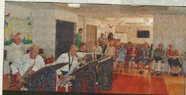
ANIMATION. Le groupe de musiciens a fait passer un bon moment aux résidents.

Le vendredi 9 juin, l'association Douceur de vivre a offert aux résidents un moment de détente avec le groupe de musiciens régionaux « 4 notes ». Plusieurs dames bénévoles avaient fabriqué pour la