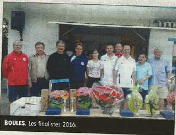
BOULES. Les finalistes 2016.

Le prochain concours à la Joyeuse boule de Panis-sières sera le 16 doublettes toutes divisions sur invitation, pour le challenge Jean-Paul Vérot, qui aura lieu le dimanche 25 juin prochain.