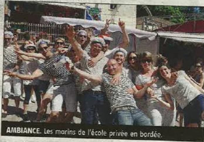
AMBIANCE. Les marins de l'école privée en bordée.

Le défilé de chars a eu lieu les 2 jours : en nocturne le samedi et dans l'après-midi du dimanche. Les cinq chars avaient été réalisés par l'école privée Jeanne d'Arc, le sou des écoles, les Grands