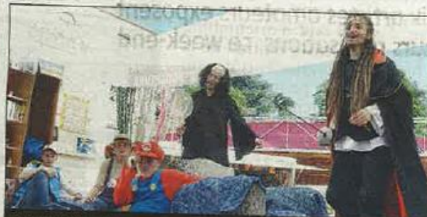
PARTICIPATION. La MJC avait aussi son char.