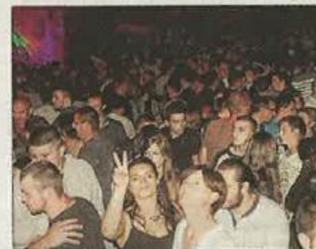
■ Le bal du samedi soir a réuni énormément de monde sur la place de l'Église.