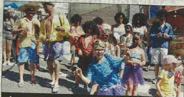
FÊTE. Le Sou des écoles pendant le défilé.