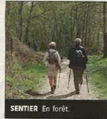
SENTIER En forêt.

Les Amis de la nature ont apprécié l'aide des communes traversées et donnent déjà rendez-vous le lundi de Pâques 2018 au départ de Panissières. ■