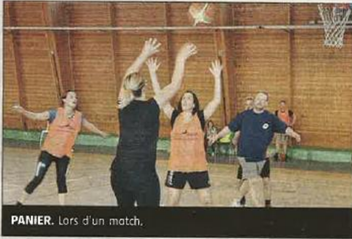
PANIER. Lors d'un match.

Le tournoi de basket inter-associations était organisé par le CAP Basket et a eu lieu ce dernier samedi 22 avril au gymnase.