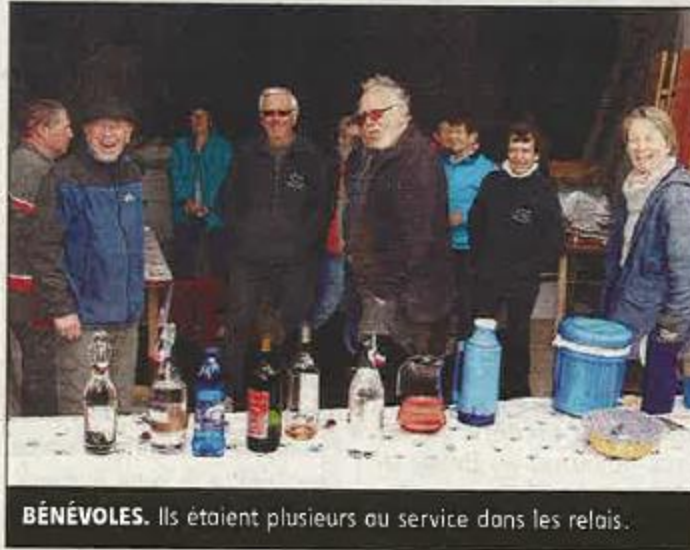
BÉNÉVOLES. Ils étaient plusieurs au service dans les relais.

de Donzy, mise en valeur par l'association du patrimoine de Donzy, était le point d'orgue des différents circuits.