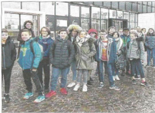
■ Les trois classes de 3 e ont visité le musée d'Art moderne et contemporain de Saint-Etienne.