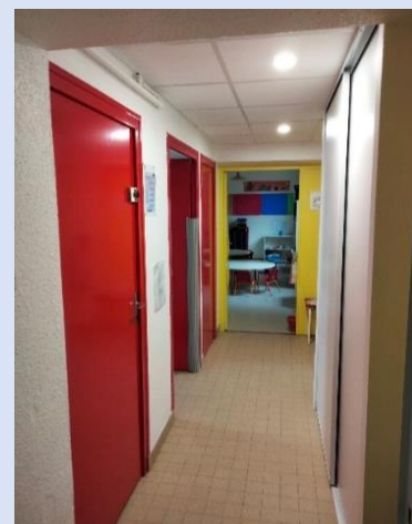
Couloir Ecole Maternelle

Travaux réalisés par les services techniques : menuiserie, peinture et électricité