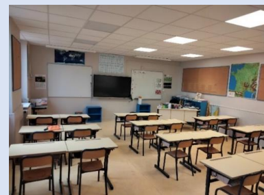
Classe Ecole Elémentaire